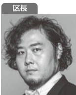
区長 田中大揮 Taiki TANAKA