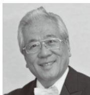
指揮 | 星出 豊 Yutaka HOSHIDE