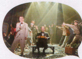
『どんぶりの底』舞台写真

2014年、ゴリキーの『どん底』を下敷きに、何とも奇つ態、いたって破天荒、絶望の喜劇と評された『どんぶりの底』に続き、戌井昭人が流山児★事務所に書き下ろす第2弾は、ノーベル文学賞受賞作家IIサミュエル・ベケットの『ゴドーを待ちながら』をモチーフにした新作です。究極の「無意味」とエンターテインメントが交錯し、不条理を超えた人間の存在を描く音楽劇にご期待ください。