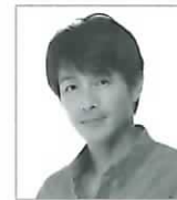
吉田栄作 (フランク馬場)