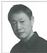
大鷹明良 (佐久間岩雄)